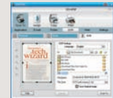
Salve como arquivo de texto editável