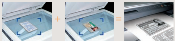
Cópia da frente → Memória → Cópia do Verso → 2 lados em 1 folha