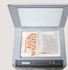
Digitalize o documento